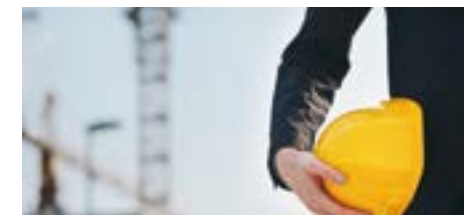
PERM4 | CONSTRUCTION/ PROPERTY