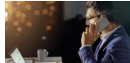
PERM4 | SALES