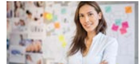
PERM4 | MARKETING