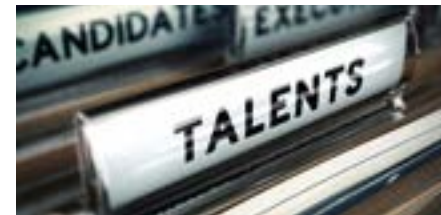
PERM4 | HR