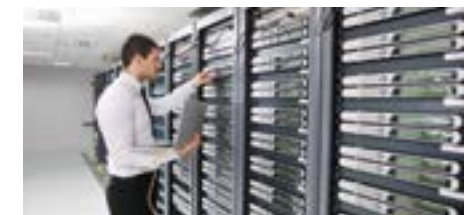
PERM4 | IT/TK