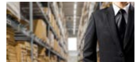
PERM4 | SUPPLY CHAIN MANAGEMENT