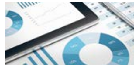
PERM4 | FINANCE