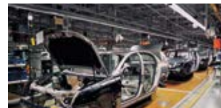
PERM4 | ENGINEERING